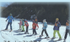
スキーレッスンの様子

全体の責任者として、PENSの職員が2名同行いたします。野外教育のグループワークやリスクマネジメントの研修を受け、ボランティアリーダーの育成も行っている、プロの指導員です。